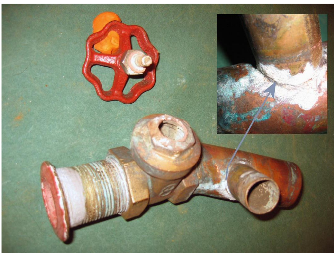
Figur nr. 2 Afzinket og knækket søventil, samt revnet messingstuds (spændingskorrosion) fra cockpitafløb.