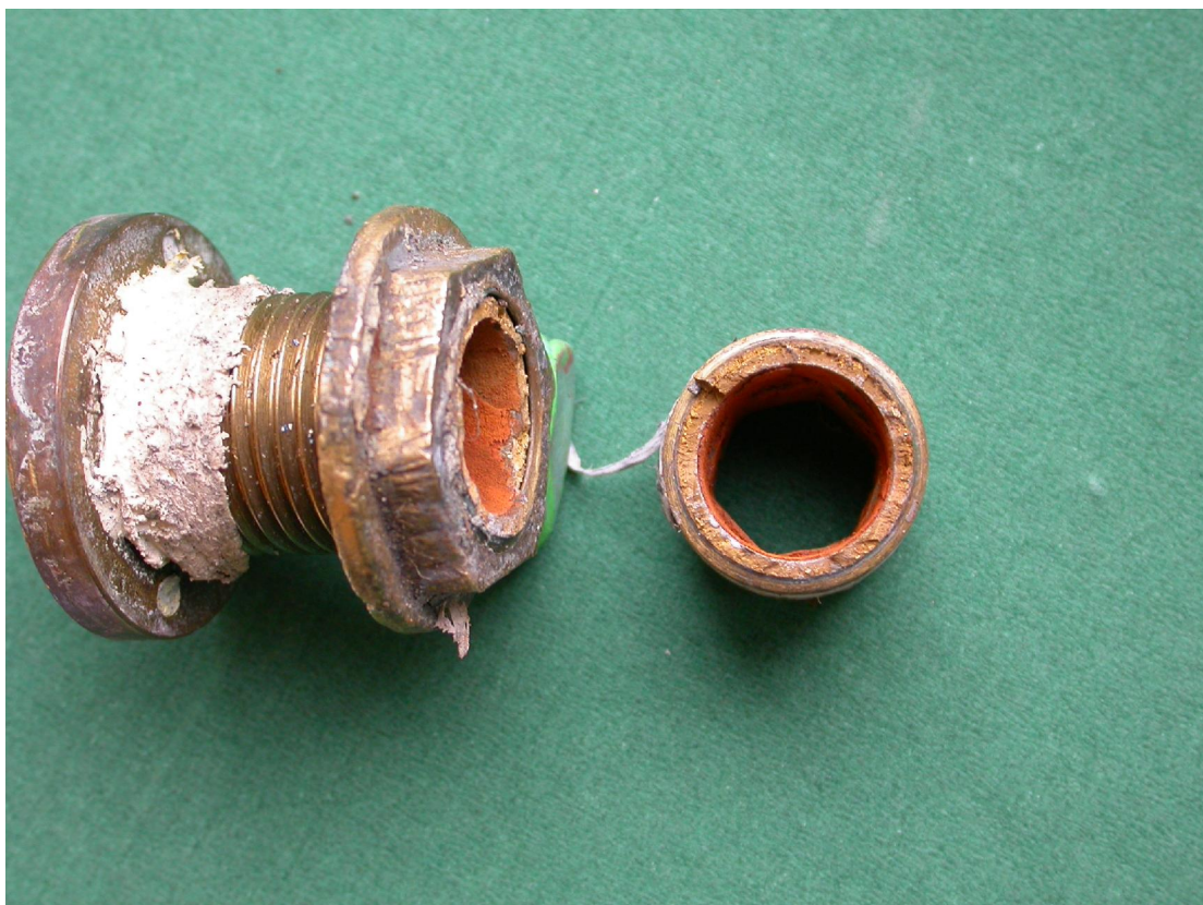
Figur nr. 1 Skroggennemføring til kølevand af messing, knækket i gevindet inde i båden.