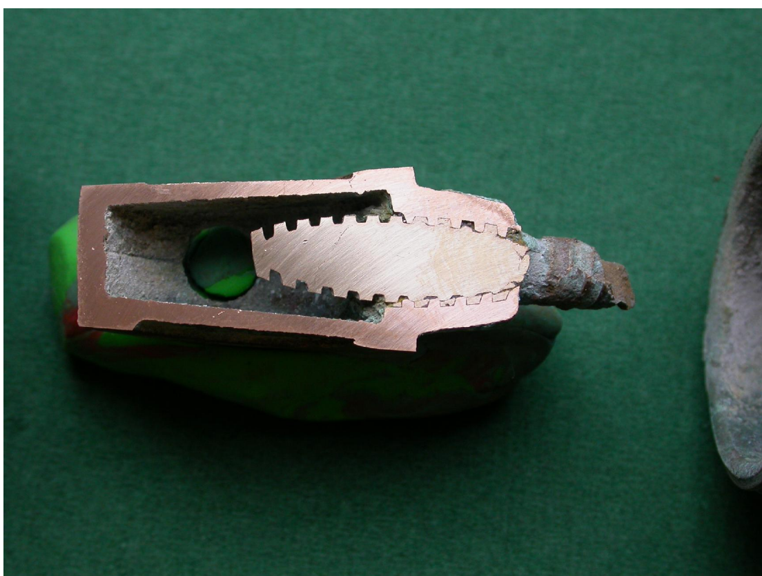
Figur nr. 4. Den knækkede spindel i skyderen. Farveforskellen imellem den lysgule messing og den rødgyldne brons er her tydelig.